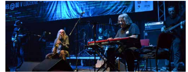
The Plastic People of the Universe

Reservierung erbeten unter: www.regensburg-1989.de Eintritt frei